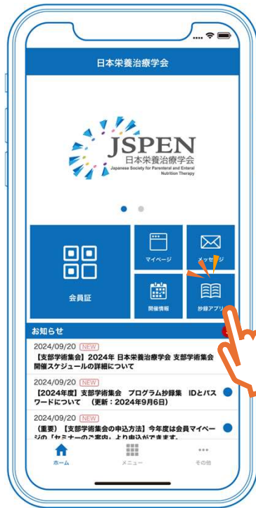
抄録アプリボタンをクリック